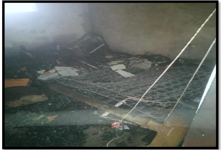
Vista de la estructura de la Vivienda dañada, se recomienda evaluacion estructural por un ingeniero.