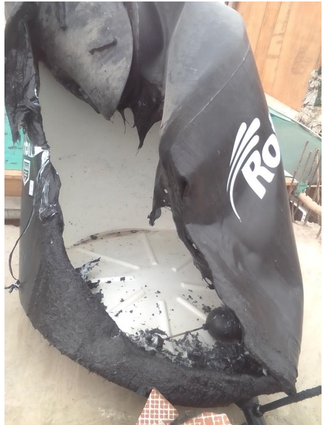
ROSITA DE LA ROCA OPERADOR 4