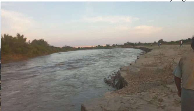
rio Ica sector Cayango carcomiendo bordo del rio