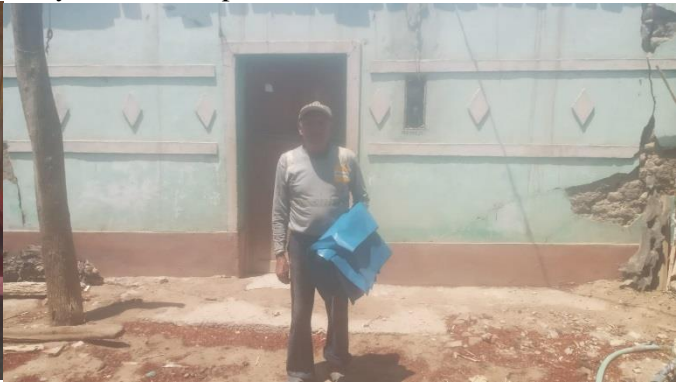
Familias del sector Paraya recibiendo plástico