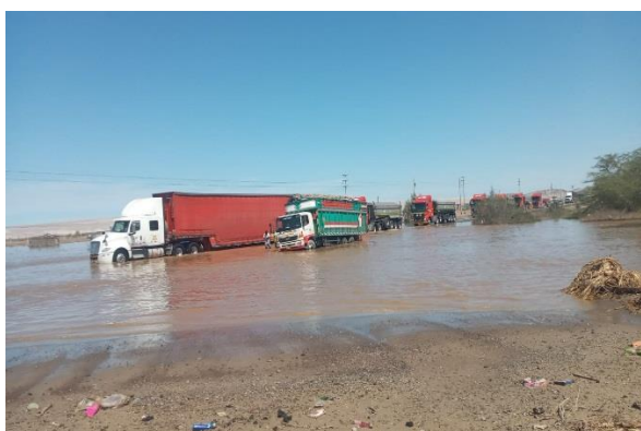
Vista de la panamericana sur km 383