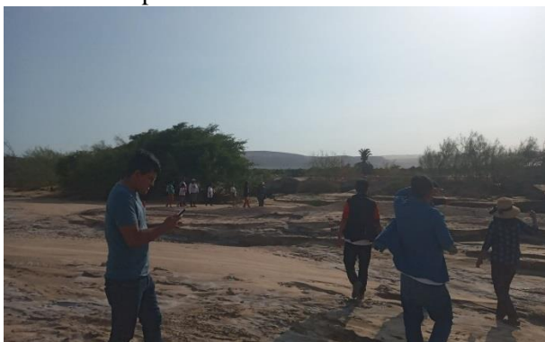
vista de área de cultivo dañados sector Cayango