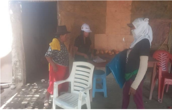
Familias del sector Paraya recibiendo plástico