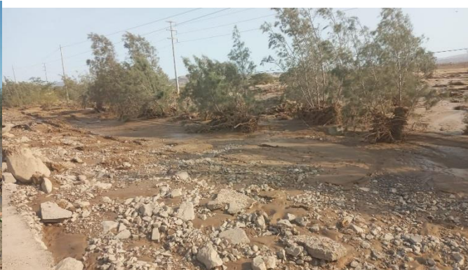
vista de área de cultivo dañados sector Cayango