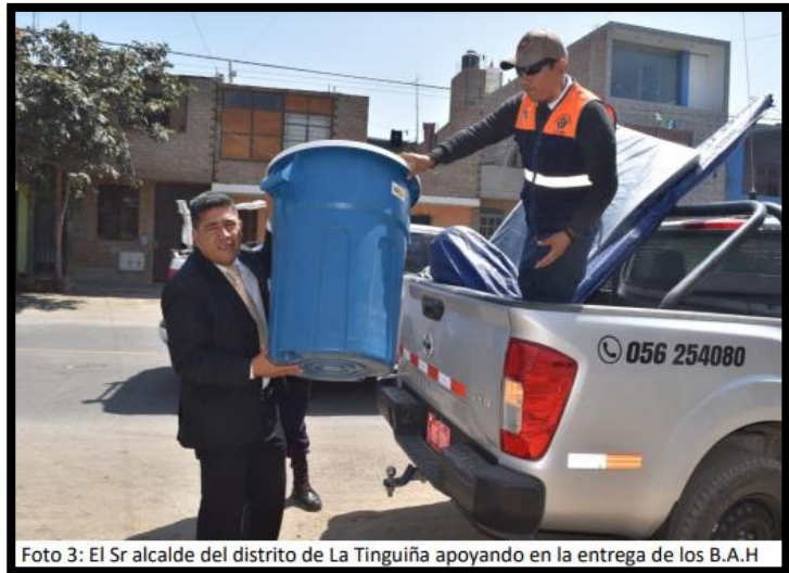
Foto 3: El Sr alcalde del distrito de La Tinguña apoyando en la entrega de los B.A.H