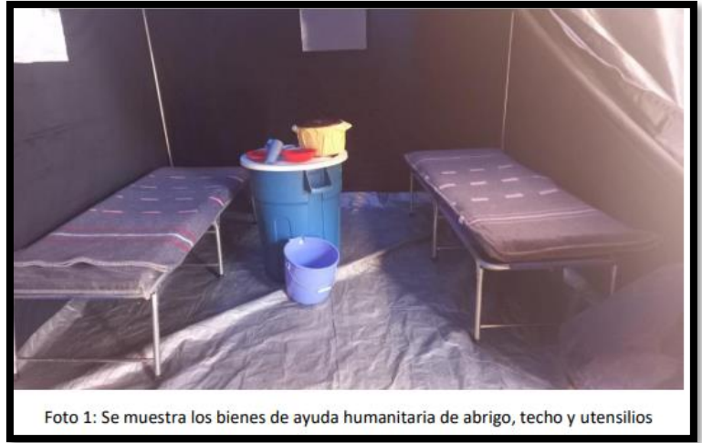
Foto 1: Se muestra los bienes de ayuda humanitaria de abrigo, techo y utensilios