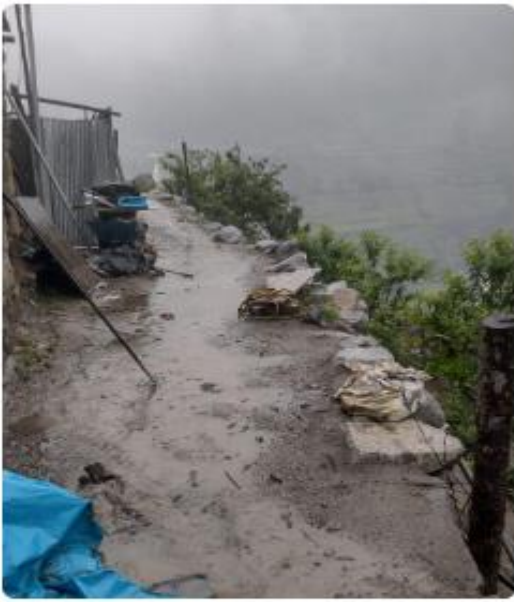
Buenas tardes, se reportan lluvias intensas en el distrito de San Juan de Yanac 7:46 p. m.