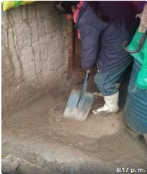
Copacabana 8:17 p. m.