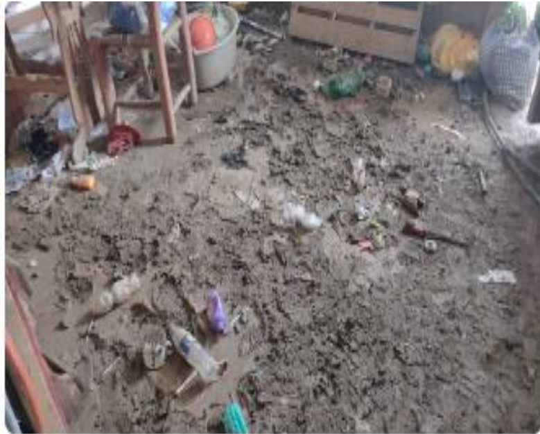
Caserío de Limani 7:46 p. m.