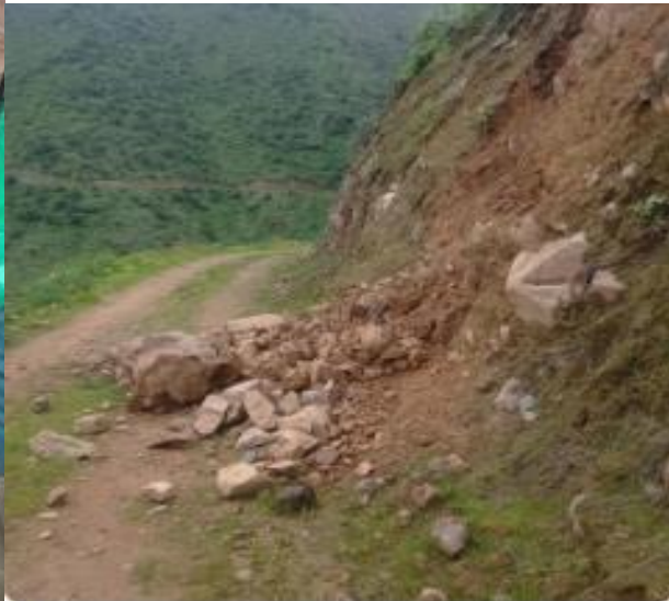
Huasipiricana desprendimiento de piedras 8:19 p. m.