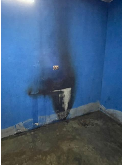
ROSITA DE LA ROCA OPERADOR 4