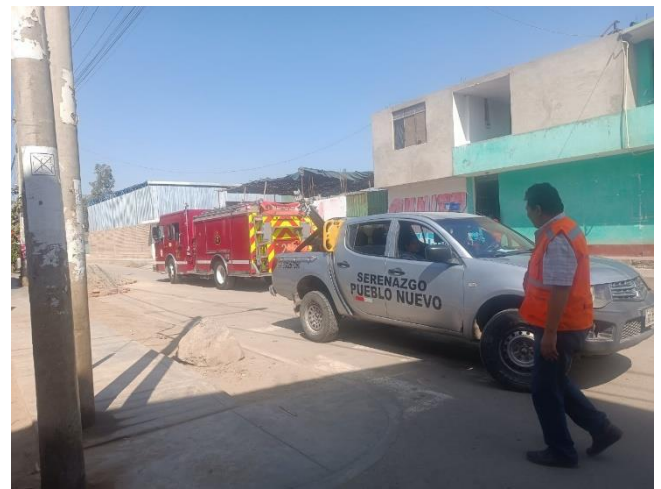
ROSITA DE LA ROCA OPERADOR 4