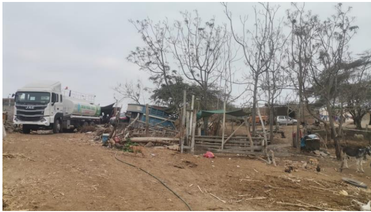
ROSITA DE LA ROCA OPERADOR 4