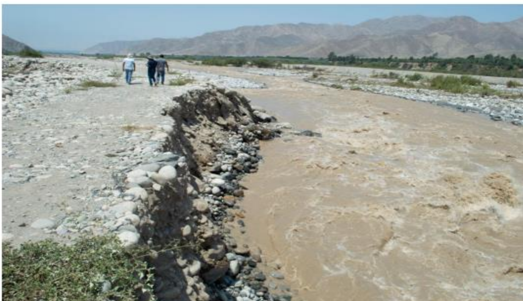
DESTRUCCIÓN PARCIAL DEL DIQUE