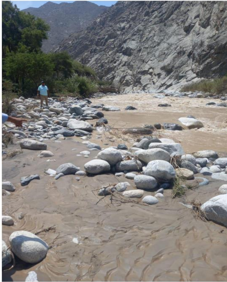
DESTRUCCIÓN TOTAL DE LA TOMA HUAMANÍ DEBIDO A LA ÚLTIMAS CRECIDAS DEL RÍO, LOS AFECTADOS SE ENCUENTRAN ACTUALMENTE SIN PODER REGAR SUS CULTIVOS