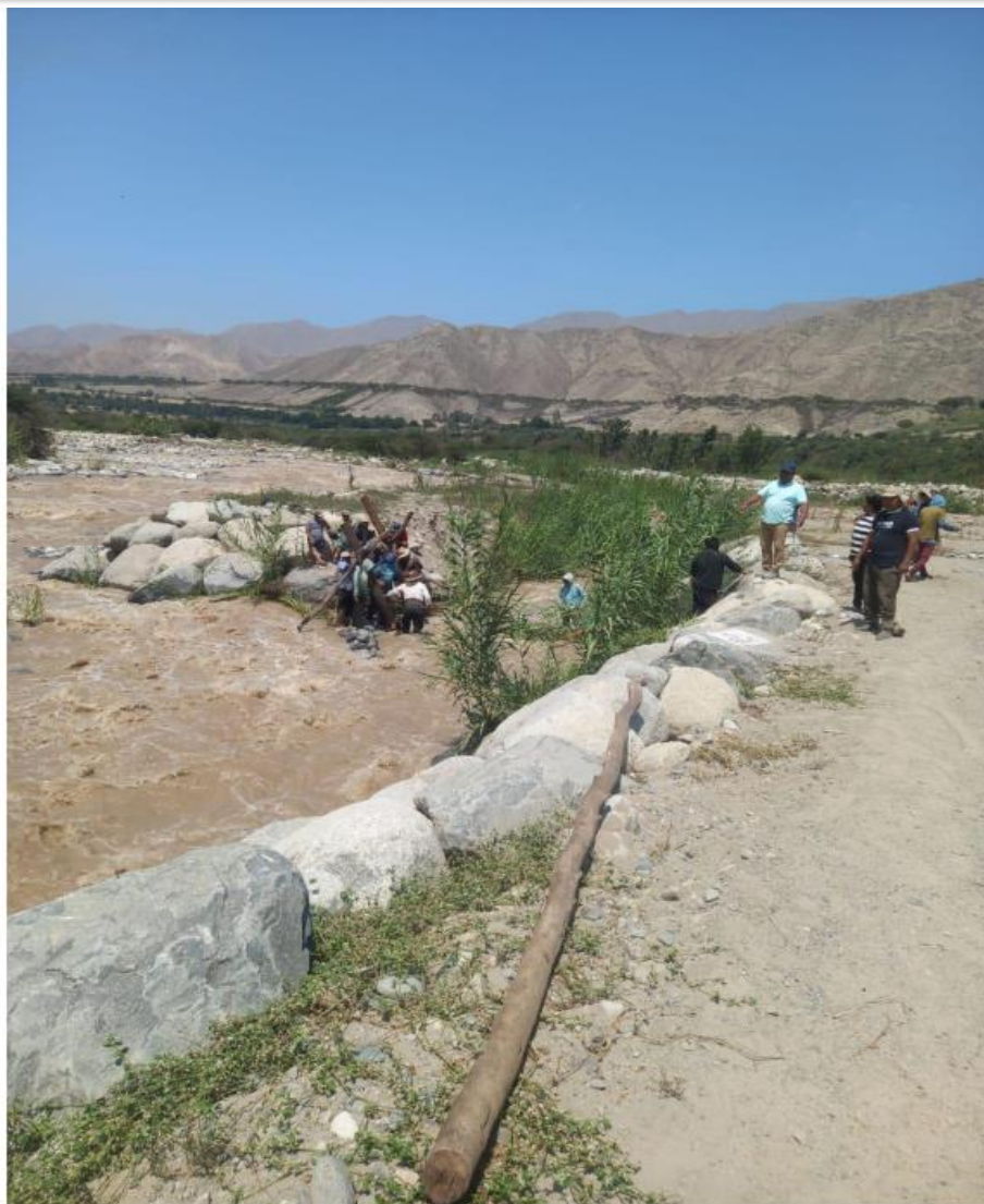
AUTORIDADES Y POBLACION AFECTADA PROTEGIENDO PARTE DE LA TOMA CASA BLANCA QUE LLEVA LAS AGUAS HACIA SUS CULTIVOS