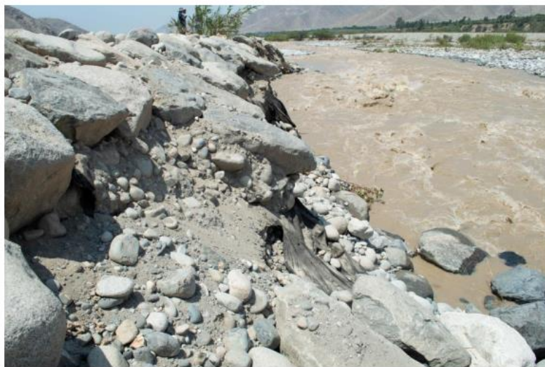
SOCAVACION Y DESPRENDIMIENTO DE ENROCADO EN DIQUE EXISTENTE