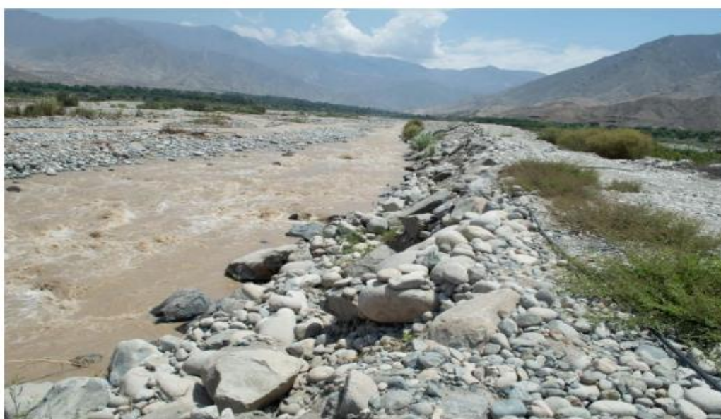
AFECTACIÓN AL ENROCADO E INFRAESTRUCTURA DE DILQUE