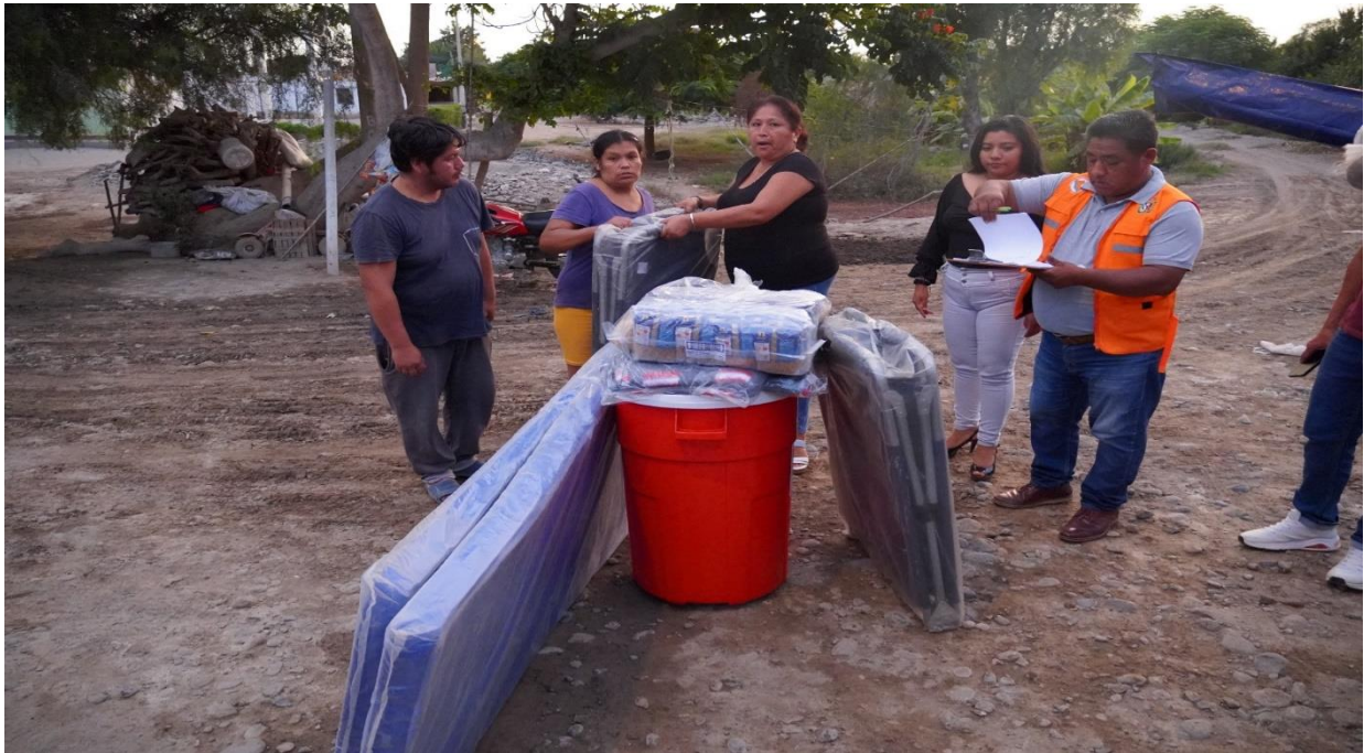
EQUIPO DE DEFENSA CIVIL