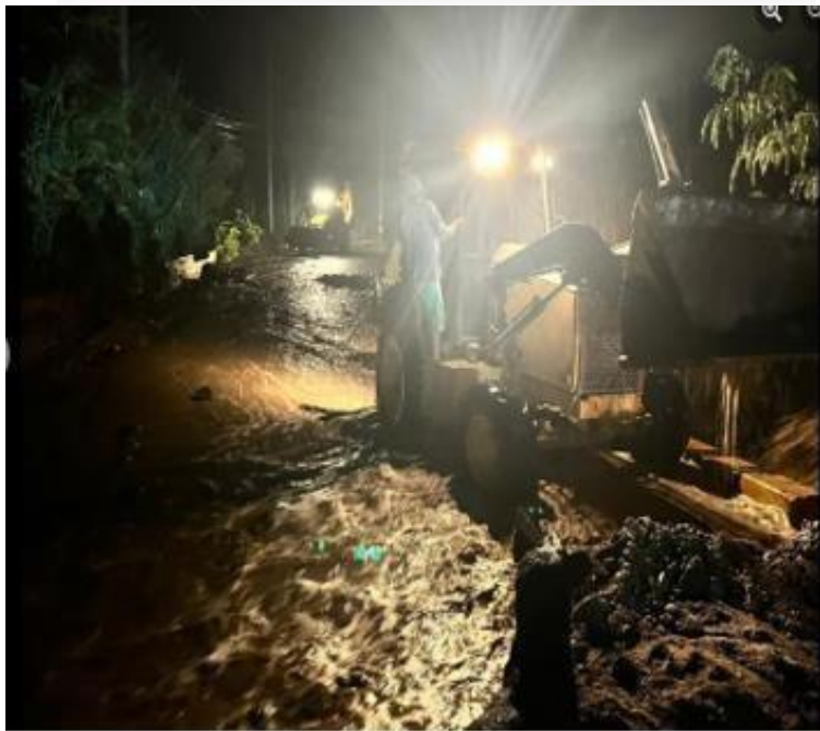
HUAYLO EN EL CENTRO POBLADO CERRILLOS