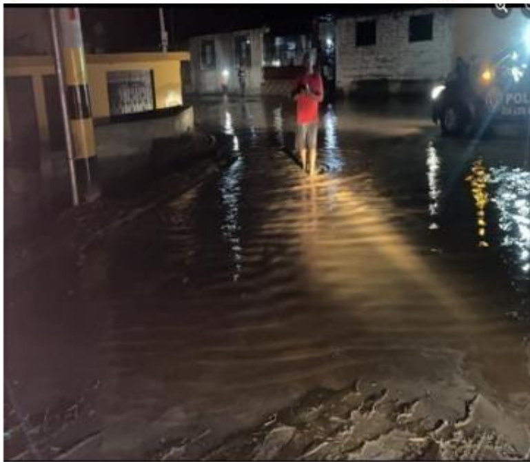
EVILINDAS Y SERVICIOS BÁSICOS AL CENTRO POBLADO CERRILLOS