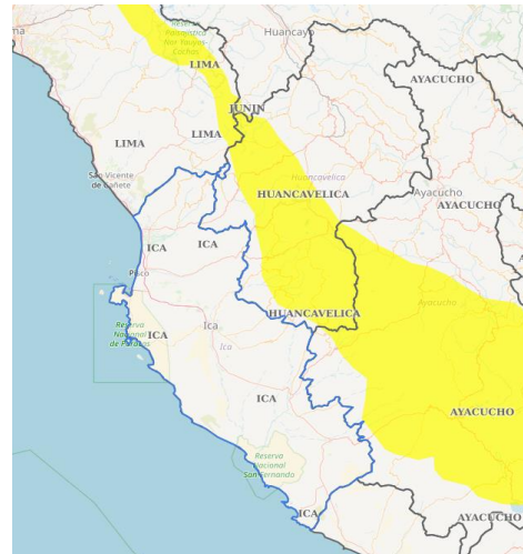
02 de noviembre

El Centro de Operaciones de Emergencia Regional, según el aviso N°327 del SENAMHI (alerta naranja) informa que, entre el viernes 1 y el sábado 2 de noviembre, se presentará el descenso de la temperatura nocturna, de moderada a fuerte intensidad, en la sierra. Además, se esperan ráfagas de viento con velocidades próximas a los 35 km/h, escasa nubosidad e incremento de la temperatura diurna y la radiación ultravioleta.