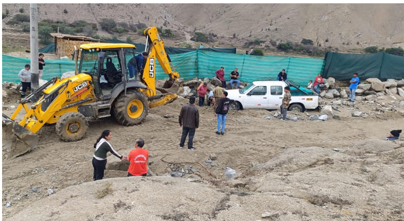
Rehabilitación de temporal de las vías interrumpidas en el sector Taralla y Tururume.