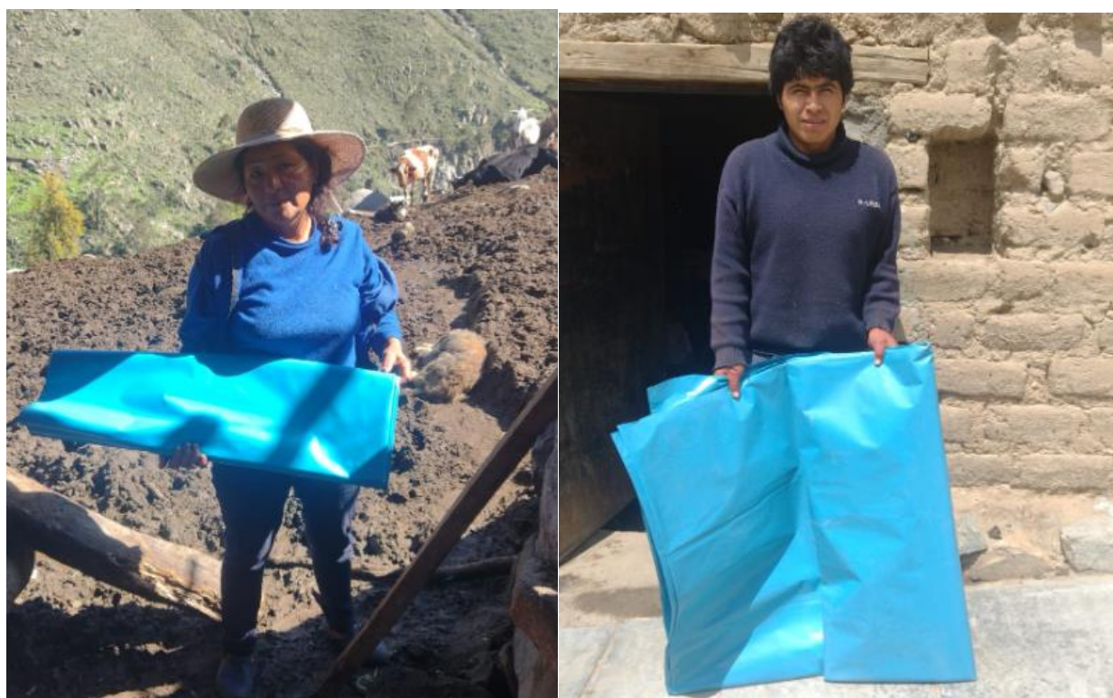
Entrega de cortes de plástico