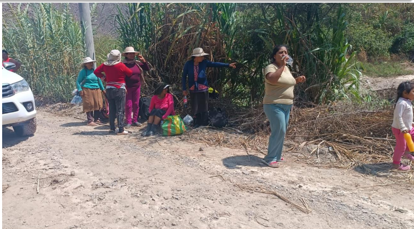
Entrega de bebidas de agua y alimentos fríos