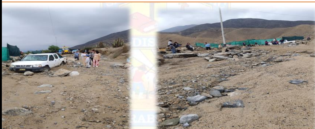
CARRETERA DESTRUIDA POR LLUVIAS INTENSAS