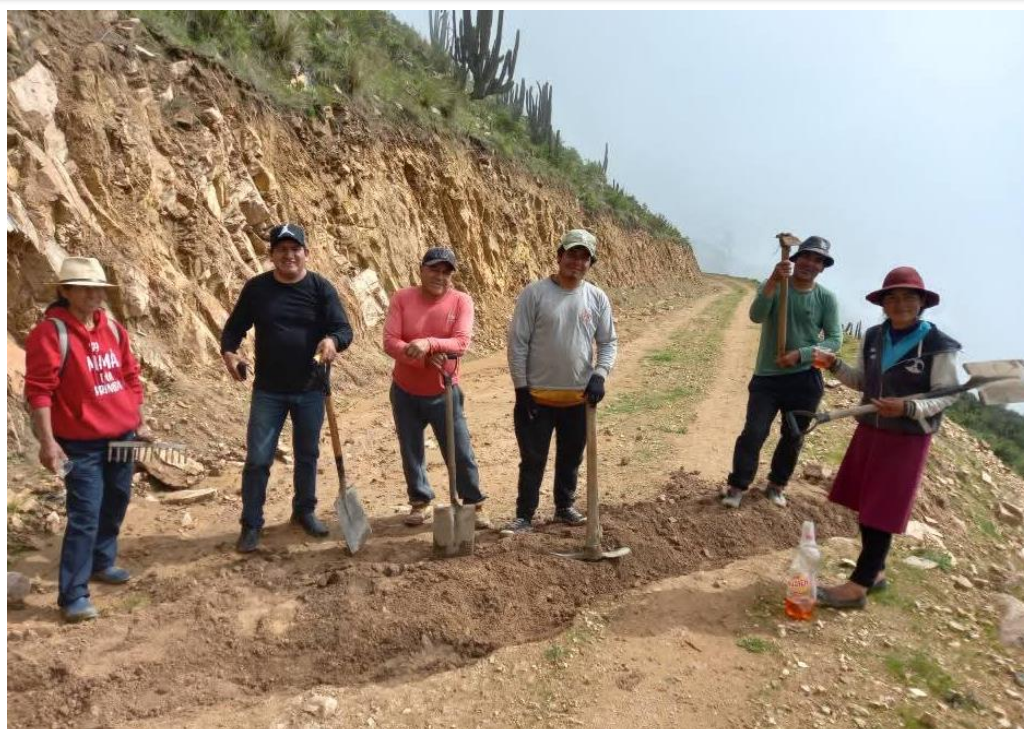
Reparación en líneas de conducción y aducción