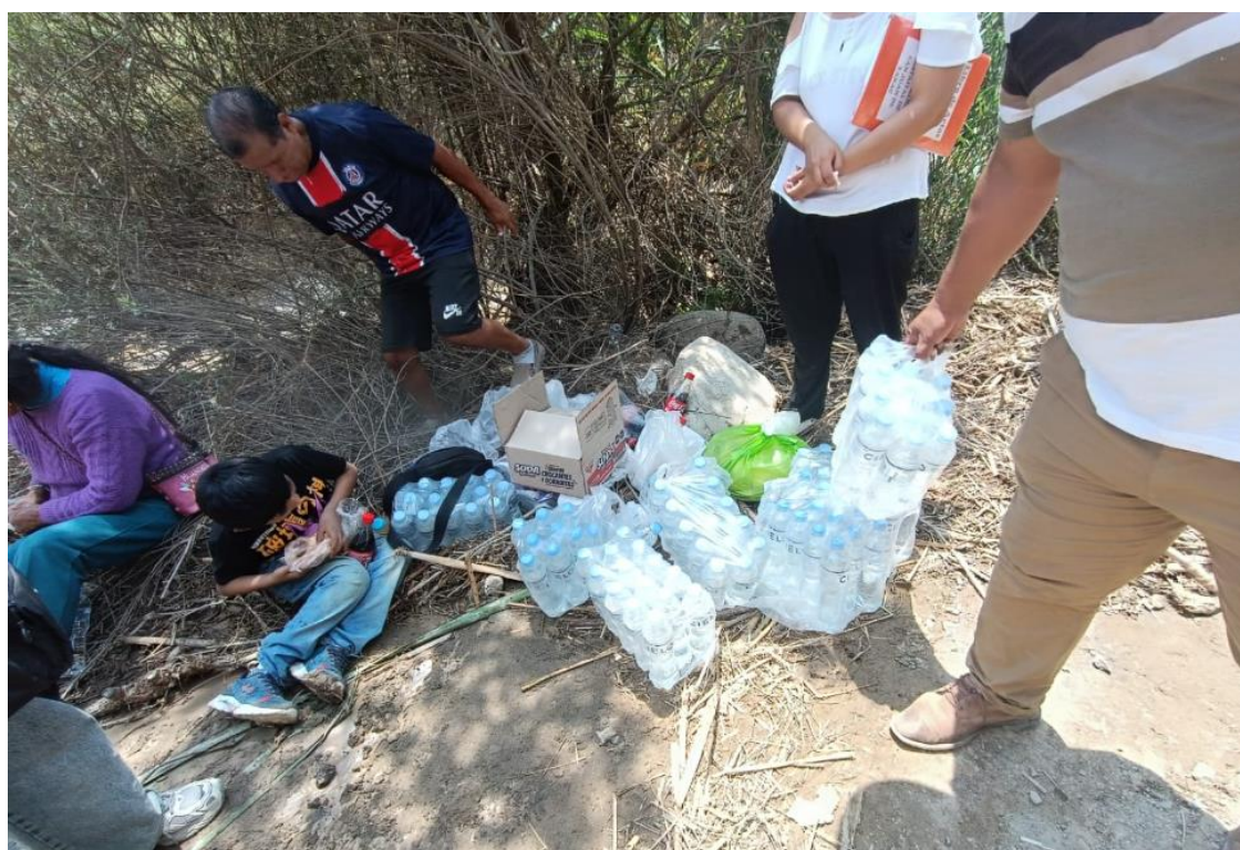
Entrega de bebidas de agua y alimentos fríos