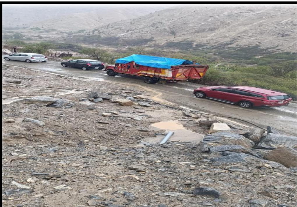
CARROS VARADOS POR MOTIVO DE AFECTACION A VIAS