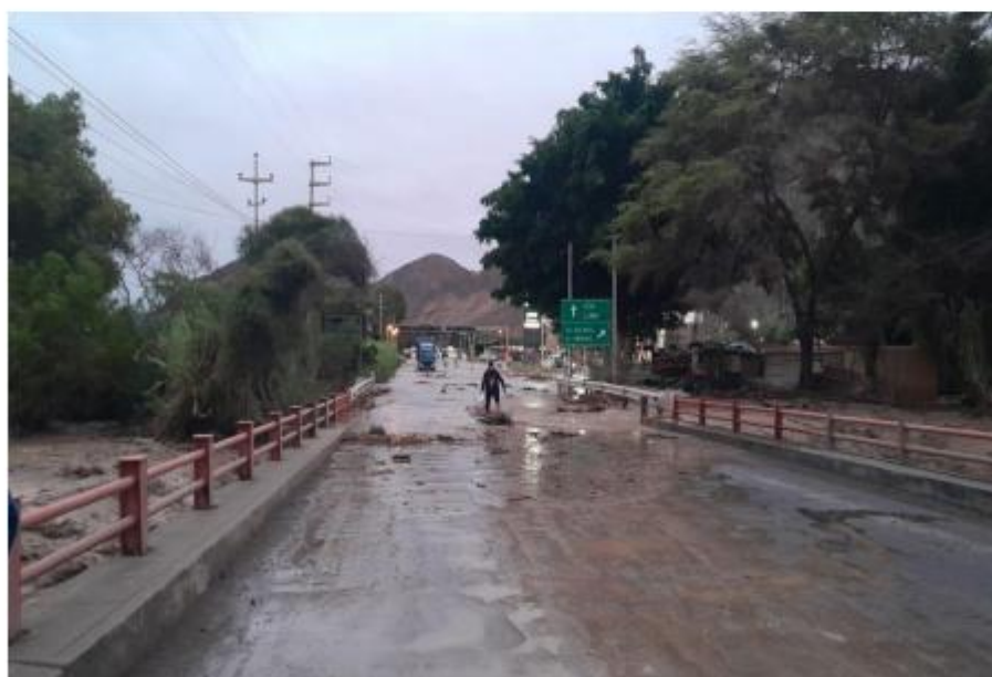
PUENTE DE SAN JOSE DE LA PANAMERICA SUR KM 421 EN EL DISTRITO DE EL INGENIO PROVINCIA DE NASCA, SOBRE EL NIVEL DEL CAUDAL DEL RIO EL INGENIO, AFECTANDO A LA PANAMERICA, CAMPO AGRICOLA Y AL COMERCIO