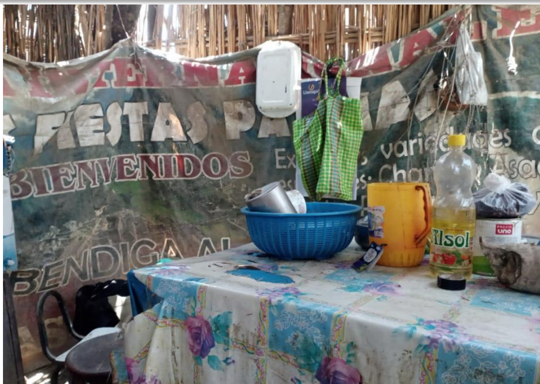
Afectación a utensilios de cocina y alimentos producto de las lluvias intensas