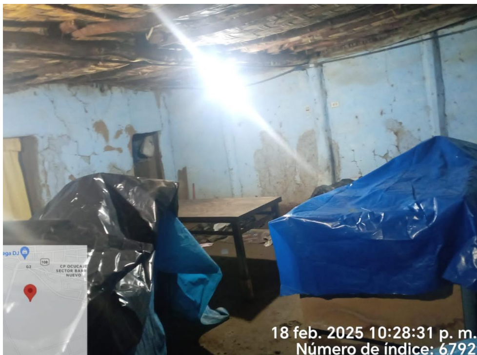
Daño de viviendas producto de las lluvias intensas