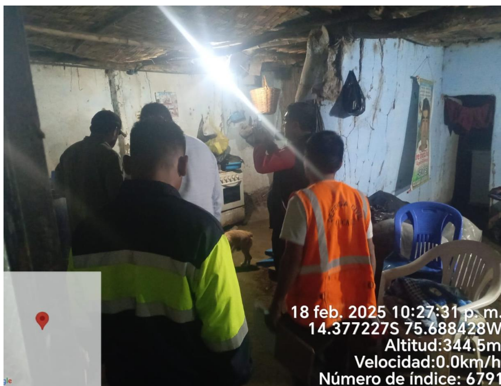
Daño de viviendas producto de las lluvias intensas