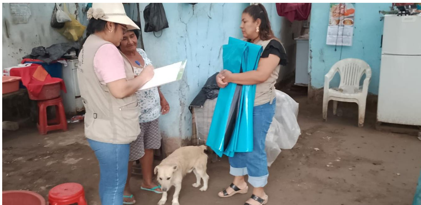
Entrega de bienes de ayuda humanitaria