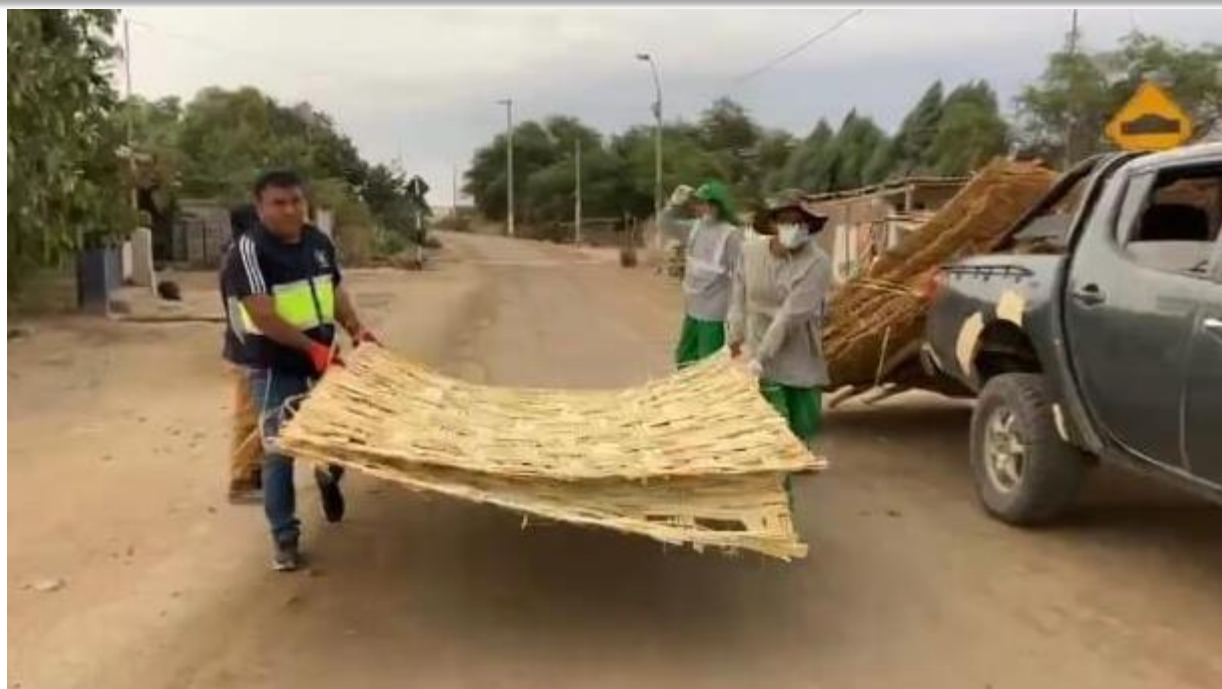
Entrega de Esteras de Caña Carrizo