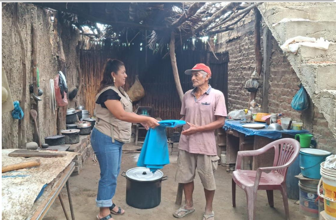
Entrega de bienes de ayuda humanitaria