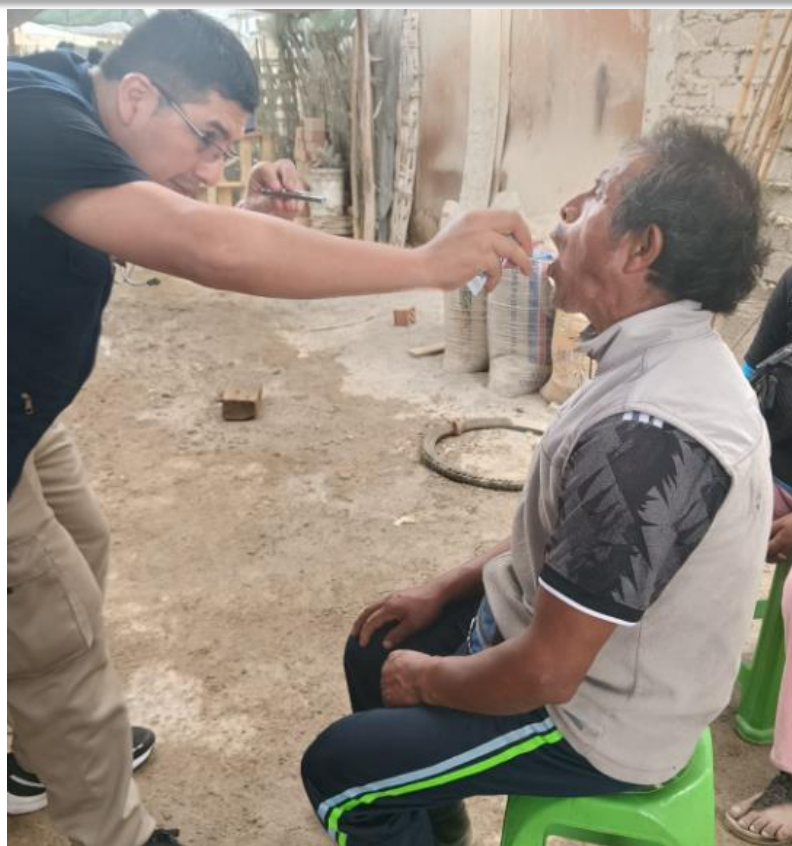
Evaluación médico post-incendio.