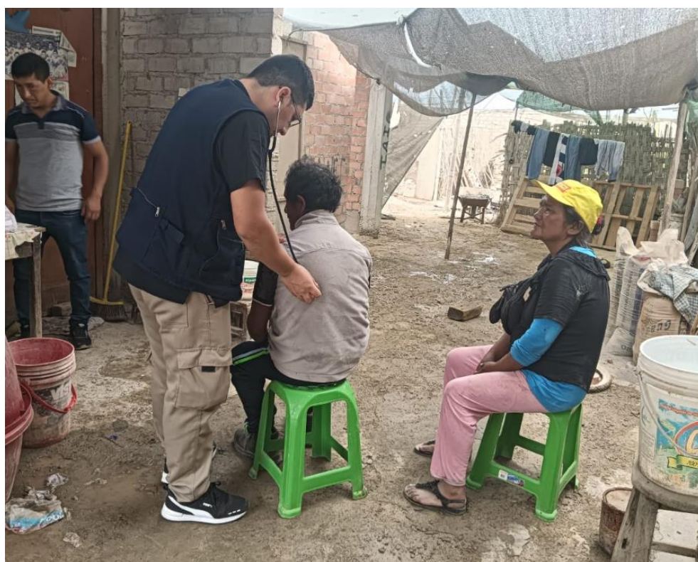
Evaluación médico post-incendio.