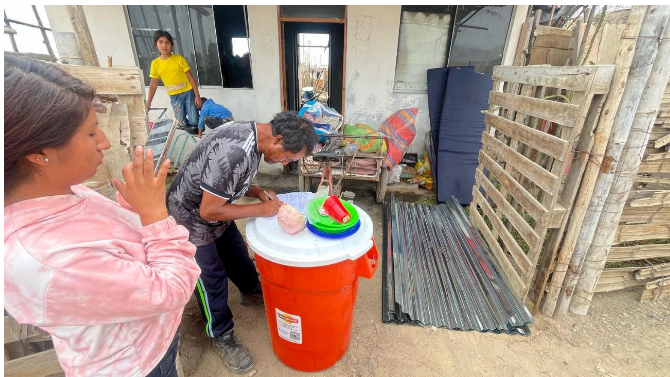
APOYO CON BAH PARA LA FAMILIA DAMNIFICADA