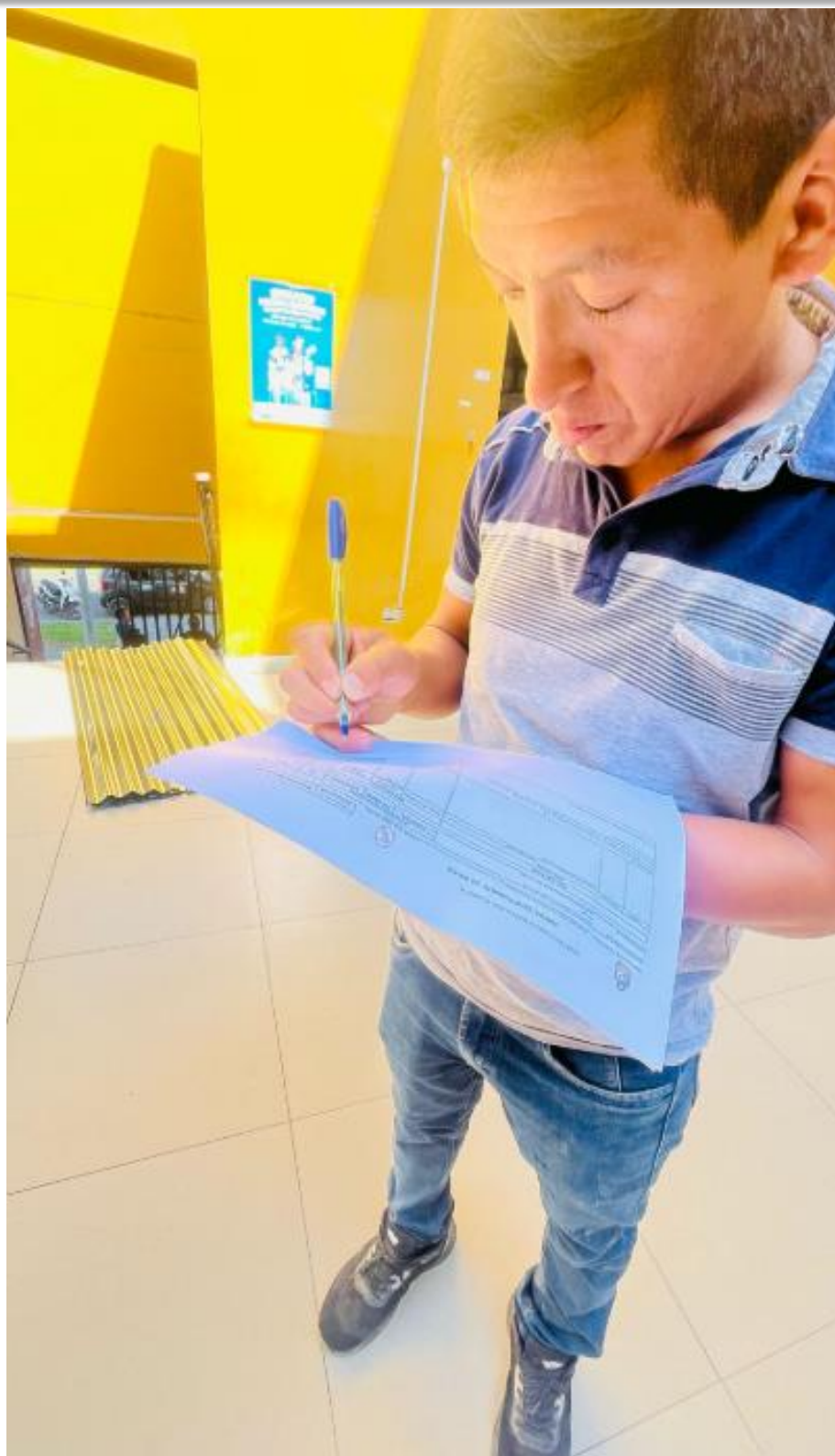
APOYO CON BAH PARA LA FAMILIA AFECTADA