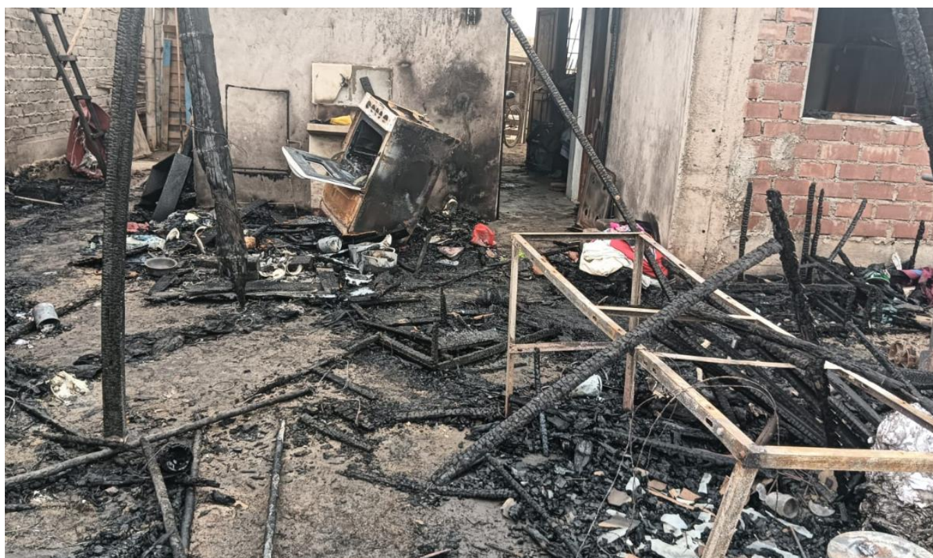
Vivienda destruida en el AA.HH Señor de los Milagros Mz J' Lt 10