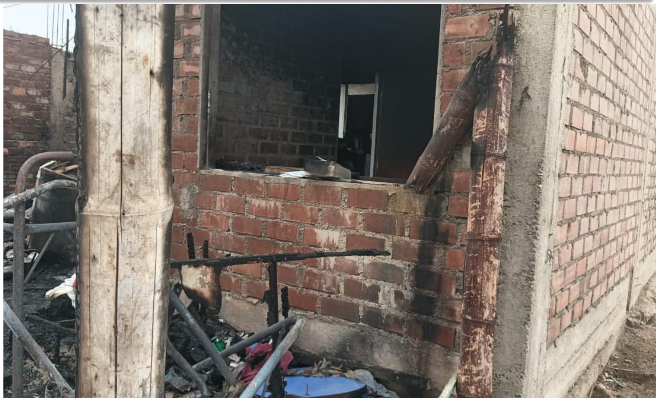
Vivienda destruida en el AA.HH Señor de los Milagros Mz J' Lt 10