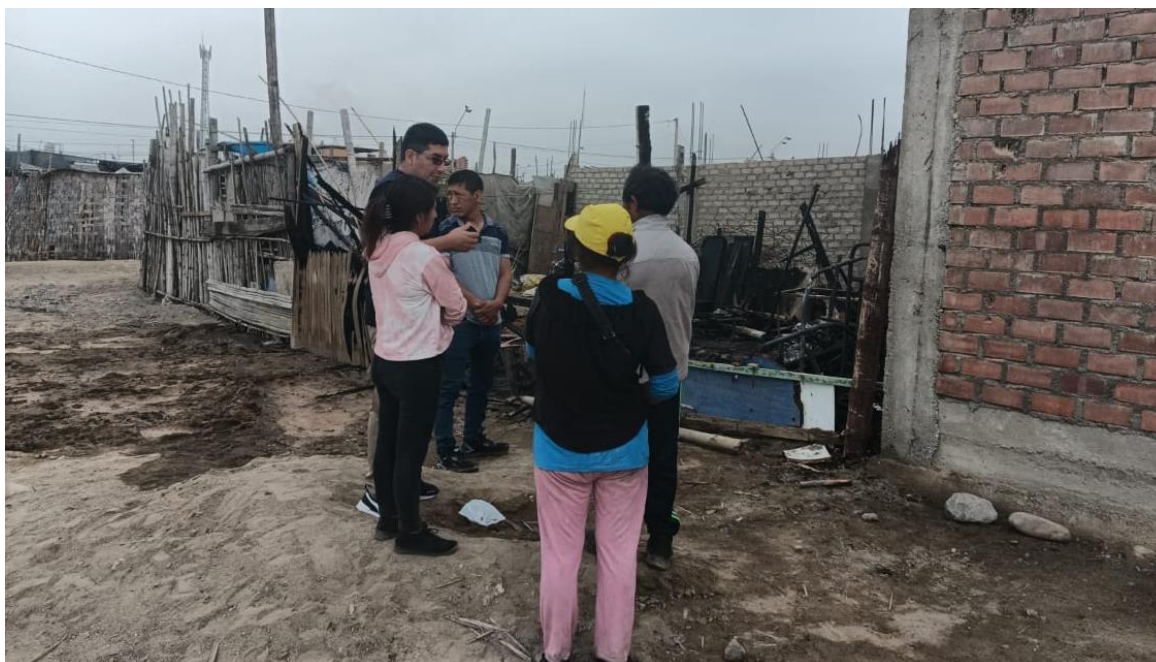
Vivienda destruida en el AA.HH Señor de los Milagros Mz J' Lt 10