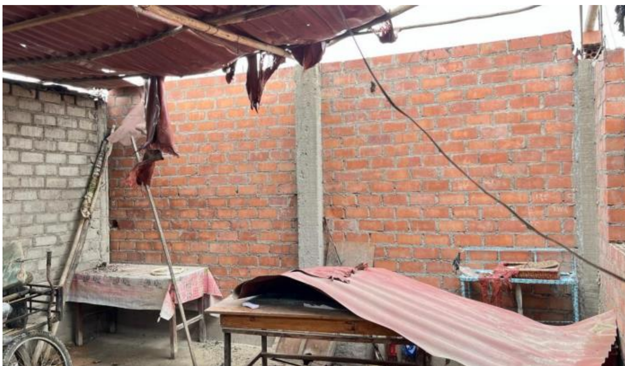
Vivienda afectada en el AA.HH Señor de los Milagros Mz J' Lt 09