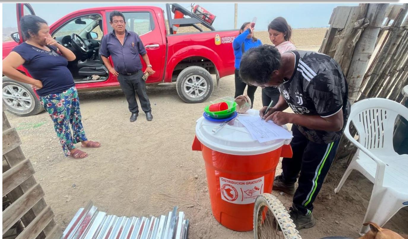
APOYO CON BAH PARA LA FAMILIA DAMNIFICADA