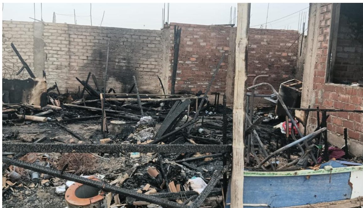
Vivienda destruida en el AA.HH Señor de los Milagros Mz J' Lt 10