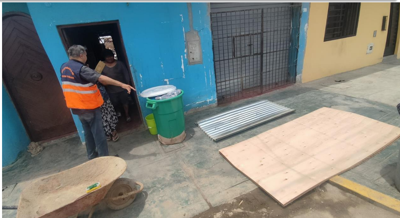
Entrega de BAH