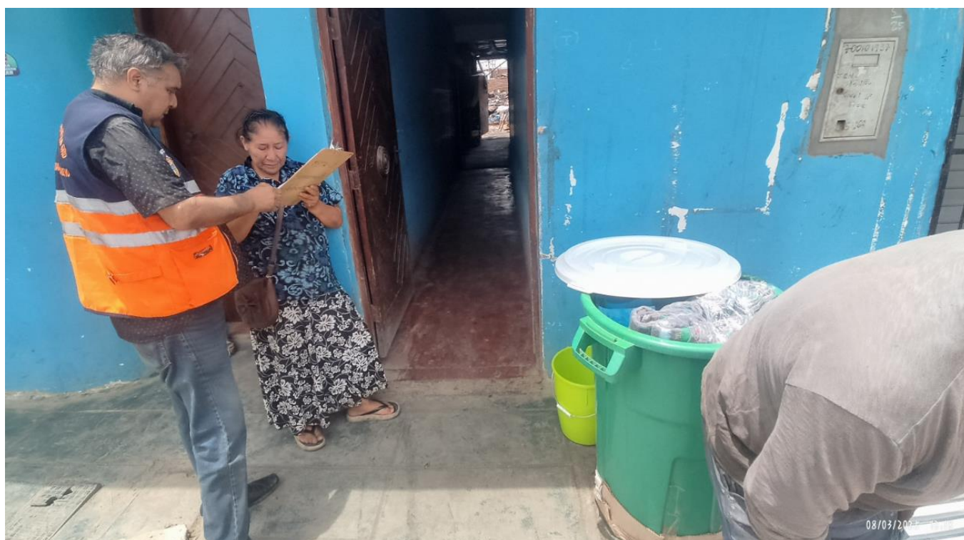
Entrega de BAH