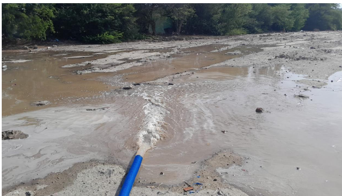
Extracción y traslado de agua hacia las áreas agrícolas (chacras) mediante sistemas de bombeo.