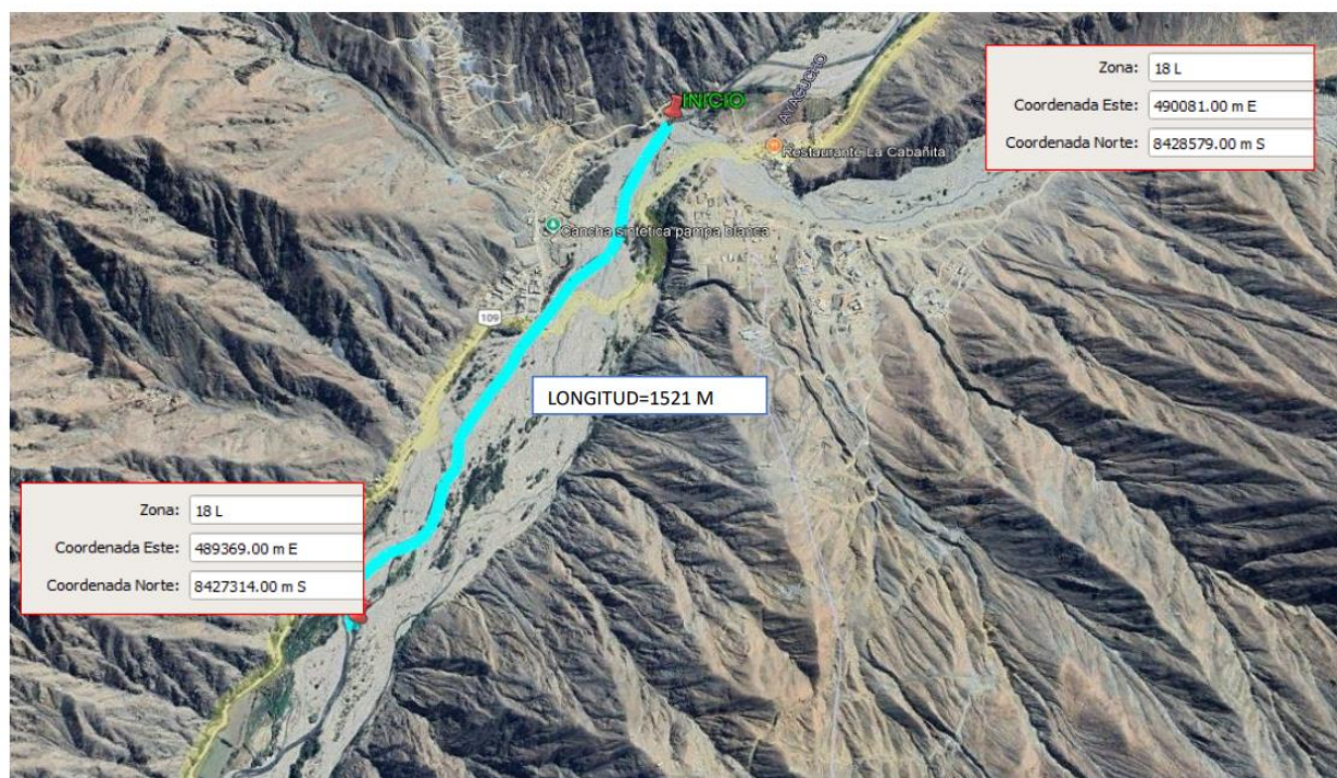
TRAMO I: CENTRO POBLADO PAMPA BLANCA