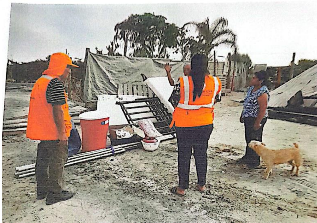
Entrega de BAH