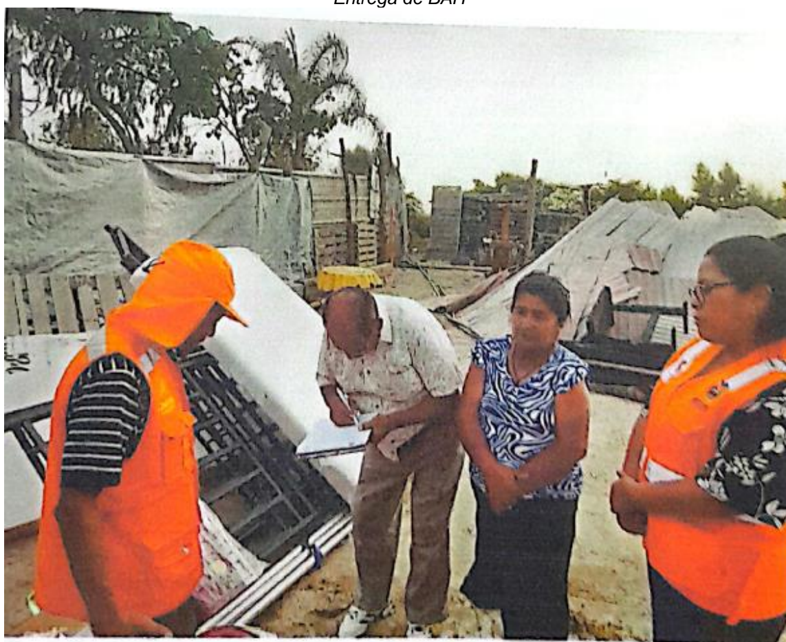
Entrega de BAH