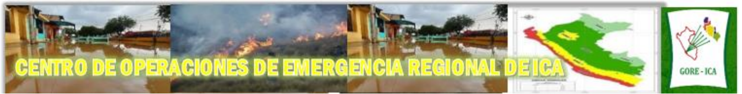
panel fotográfico del distrito de yauca del rosario