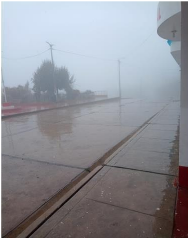
LLUVIAS INTENSAS EN SAN PEDRO DE HUACARPANA