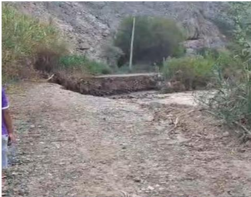
Destrucción de vía de acceso a los distritos de San Juan de Yanac y San Pedro de Huacarpana