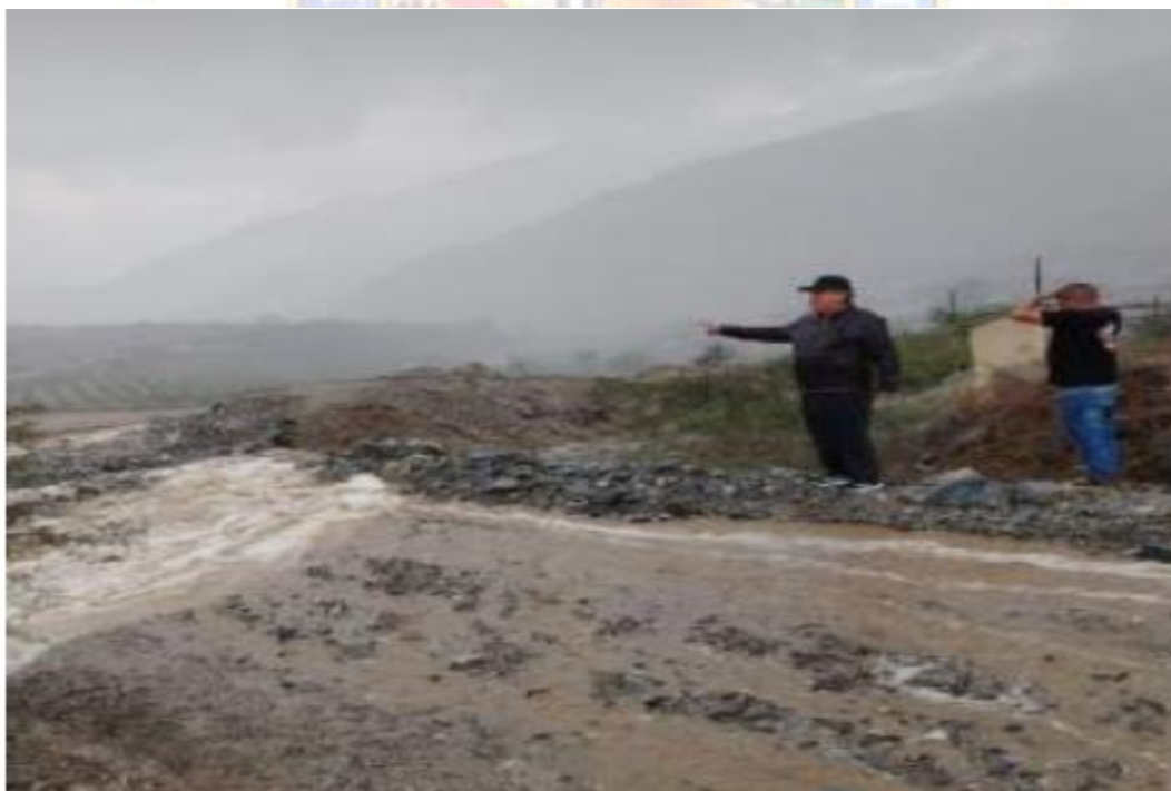
Inspección del alcalde en zona afectada, evaluando los daños producto de la activación de quebradas