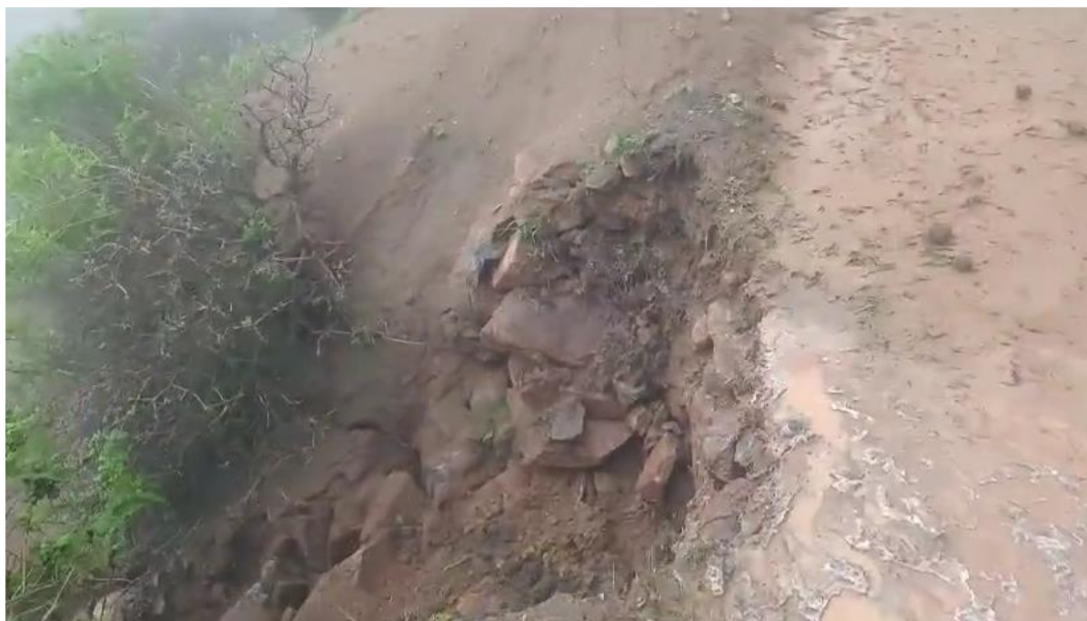
Imagen N°03. Carchos de agua y lodo en las vías afectadas – HUANCATINCO – SAN JUAN DE LUYO.