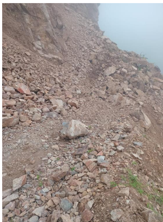
Imagen N°06. Deslizamiento de rocas en tramo SAN JUAN DE LUYO – HUIRPINA