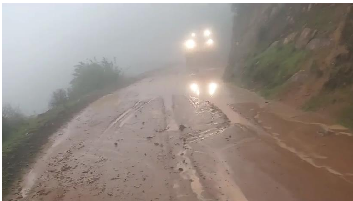
Imagen N°04. Carchos de agua y lodo en las vías afectadas – TRAMO CHAVIN - SAN FLORIAN.