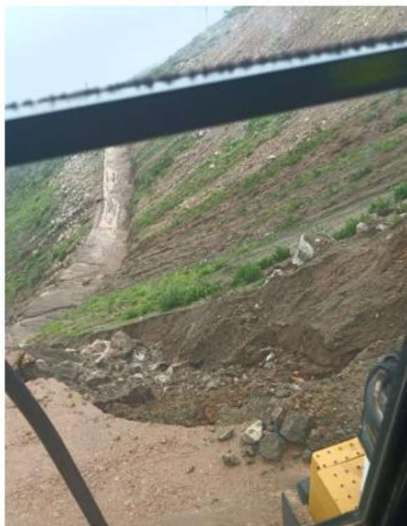
Imagen N°01. Deslizamiento en tramos afectados.