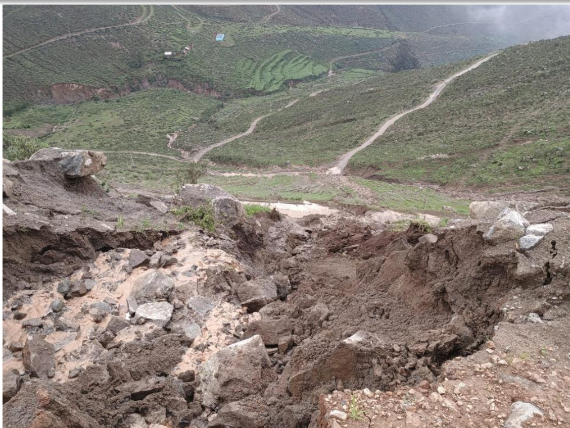
Imagen N°05. Derrumbe de suelo agrícola a lado de carretera afectada – SAN LURIN