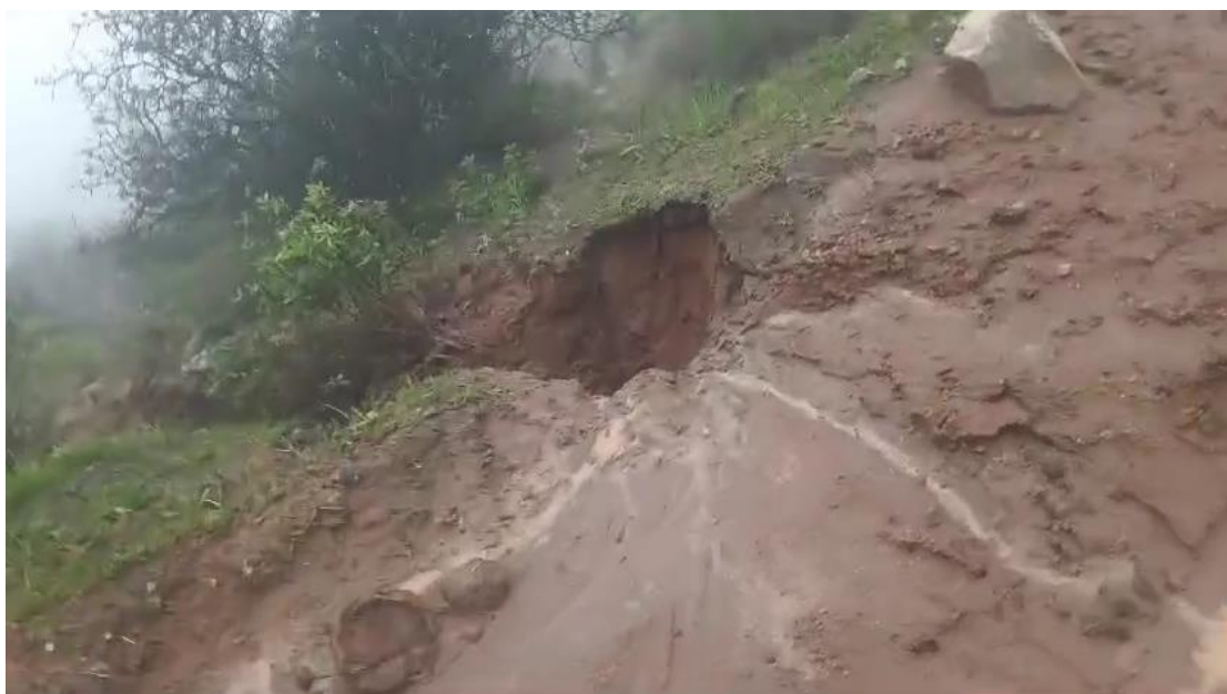
Imagen N°02. Agrietamiento en vías por humedad y lodo – TRAMO CHAVIN – UTALPALCA.