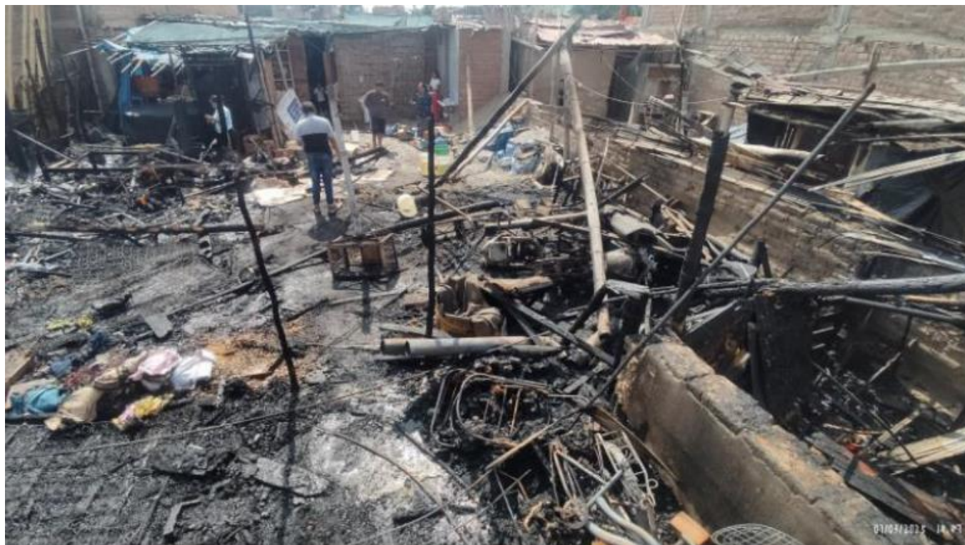
Daños a la vivienda y bienes producto del incendio