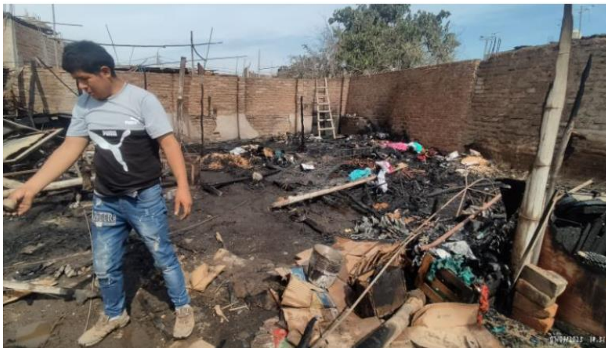
Daños a la vivienda y bienes producto del incendio