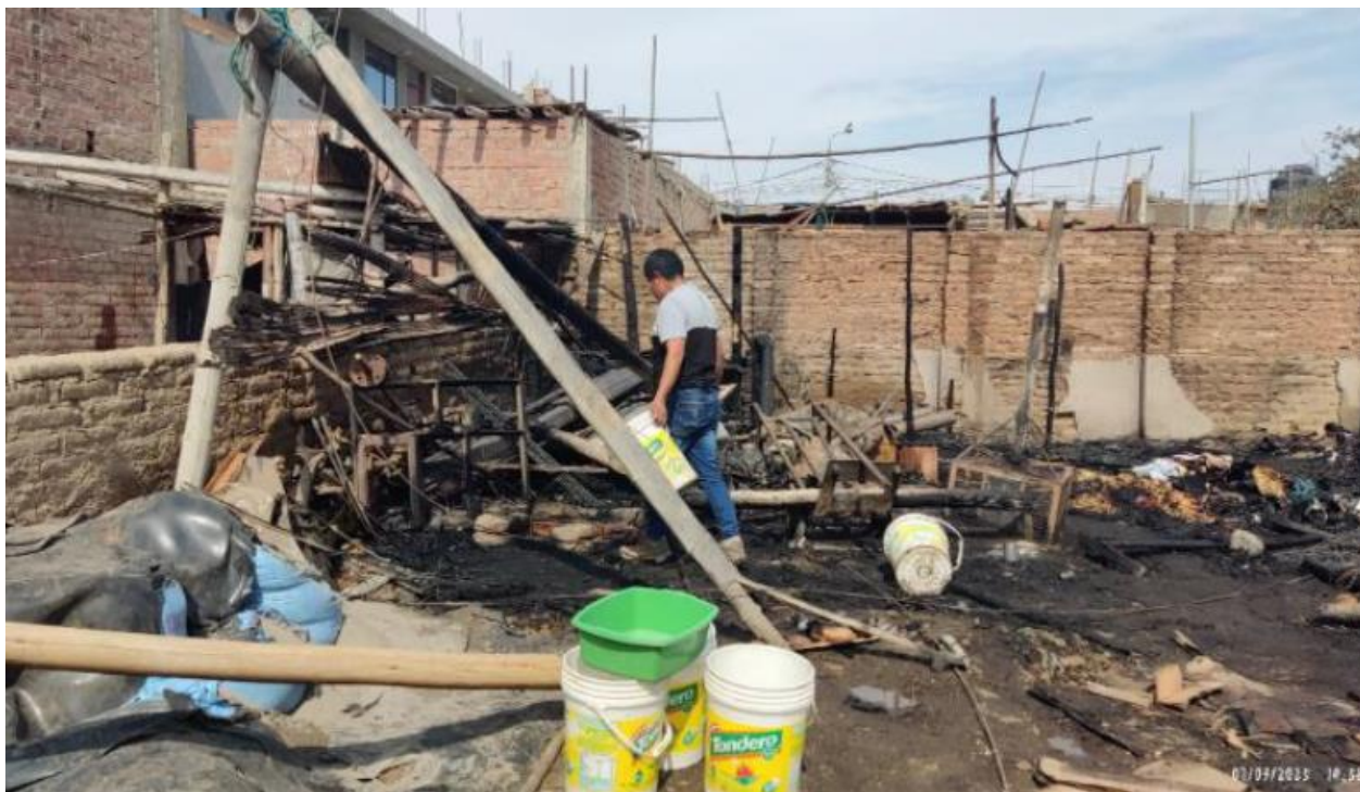
Daños a la vivienda y bienes producto del incendio